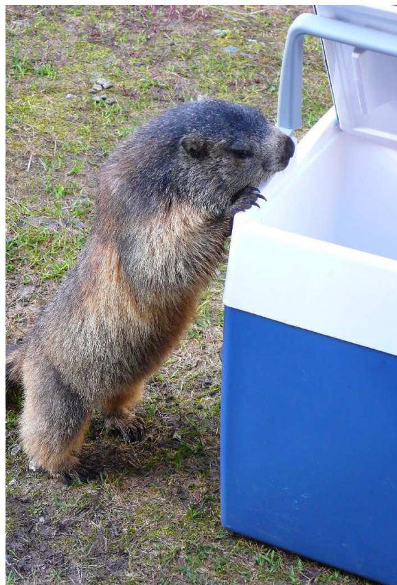
| Und was gibt's bei mir heute?

Am Abend noch schnell im Supermarkt ein paar Kleinigkeiten für ein französisches Gourmetmenu besorgen, den nötigen Rotwein und dann müde und zufrieden ins Bett fallen. Kann es noch etwas schöneres im Leben geben? Klar! Am nächsten Tag wieder Sonne und wieder eine Traumtour!