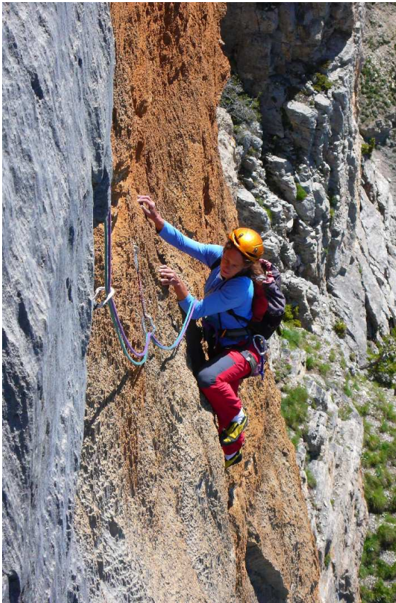
| Rauer roter Tropflochfels und grauer Plattenkalk in der „Mémoire de l'eau“.

Im Vergleich zu den Dolomiten sind diese Tage zwar nicht minder ärgerlich aber immerhin an einer Hand abzuzählen.